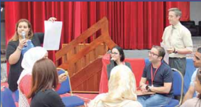
Teachers Being Oriented!