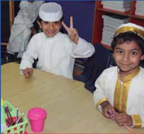
Arent We Sweet!