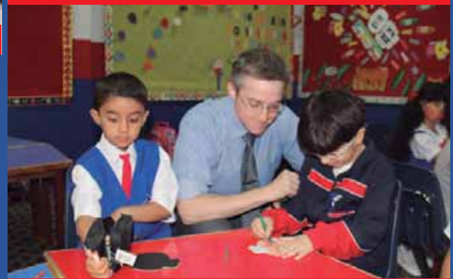
First Day at School