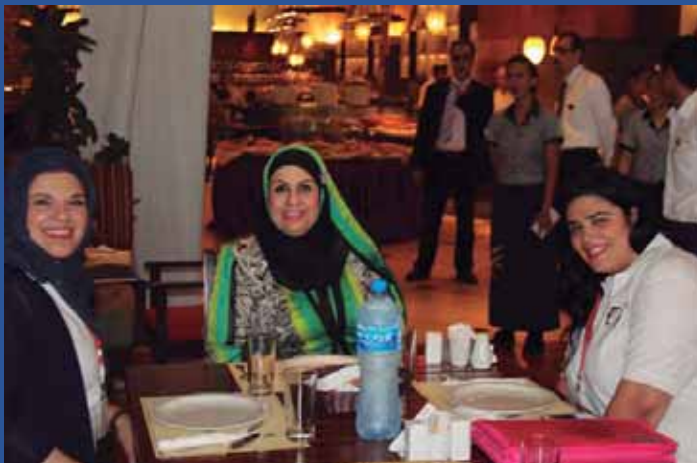
Amazing Food at AHIS Staff Lunch