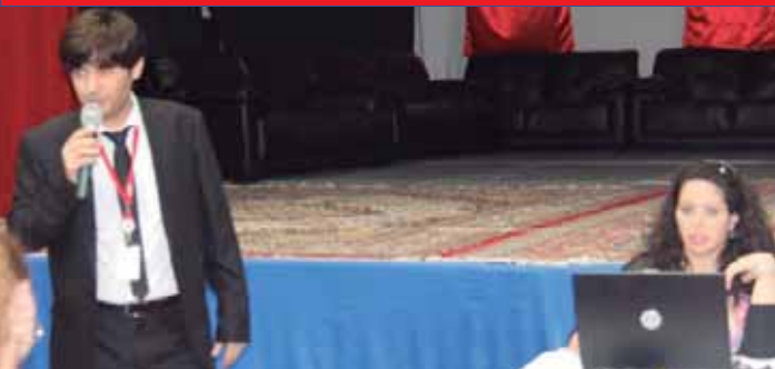
Parents Info Night